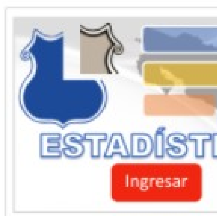
Ilustración 1. Espacio en la página web de OIJ destinado para la consulta de estadísticas policiales

En esta oportunidad dada la importancia de que la población nacional cuente con una manera fácil y práctica de obtener datos estadísticos de la incidencia criminal reportada ante el OIJ, se pone a disposición del público en general un apartado en la página web institucional donde se pueden realizar este tipo de consultas.