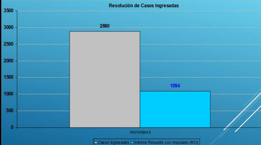
GRÁFICO #1 RESOLUCIÓN Y DENUNCIAS INGRESADAS, OIJ PUNTARENAS, AÑO 2019

De acuerdo con lo anterior, el promedio de resolución durante el periodo en estudio fue de 31.4% .