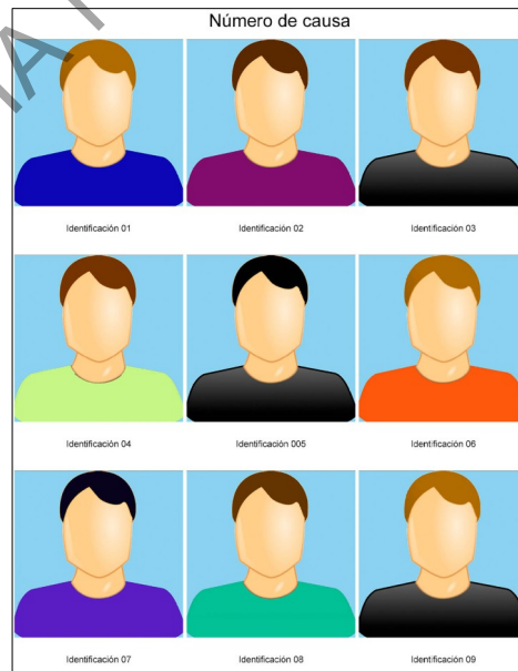
Imagen 2 ( Plantilla de listado)

7.2.5 Debe entregar dos plantillas por cada sospechoso, la plantilla numerada y la otra con algún identificador (nombre, número de cédula o número de expediente). A esta se le denomina plantilla de listado. Ver imagen 2.