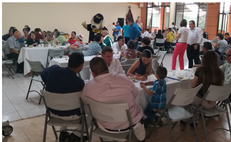
Ilustración 2. Tarde de café policial con OIJ, San Carlos, viernes 18 mayo 2018

La tarde de Café Policial, dio inicio a las 2:00pm y finalizó aproximadamente a las 4:00 p.m., siendo que en esas dos horas el OIJ reafirmó su compromiso con la sociedad de promover el acercamiento para con ellos y juntos trabajar por un país más seguro. A la misma asistieron aproximadamente 50 personas.