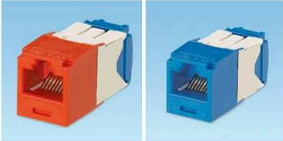
Figura 8: Conector Hembra RJ-45 Panduit CJ6X88TGRD y Panduit CJ6X88TGBU.

Categoría 6 similar a Panduit CJ6X88TGRD. Esta es la toma de usuario, se deben instalar dos por cada caja de conexión (voz y datos). El conector perteneciente a datos debe ser de color azul y el perteneciente a voz debe ser de color rojo.